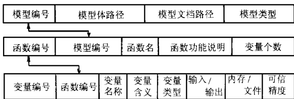
图 3 基于关系数据库的模型库管理系统结构

模型库管理系统通过如下的连接实现对模型、函数和变量的管理,每个框图都符合标准的 3NF 范式,可以用关系数据库进行管理,即为实现模型级的管理、实现函数级的调用和实现变量级的耦合。具体结构如图 3。